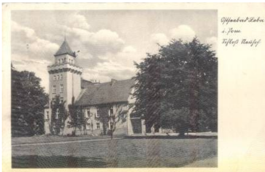
Pałac w Nowęcinnie na widokówce z lat 30. XX wieku.

Nowęcín (niem. Neuhof)- wieś leżąca w odległości około 2 km na wschód od Łeby. W roku 1905 miejscowość razem z majątkiem liczyła 206 mieszkańców, w 1939 r. – 282 mieszkańców, natomiast obecnie miejscowość liczy 545 mieszkańców.